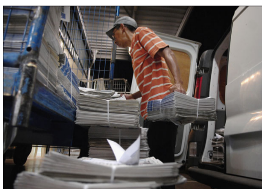
2 h 30 , fin de la répartition entre les livreurs qui débutent leur tournée nocturne.