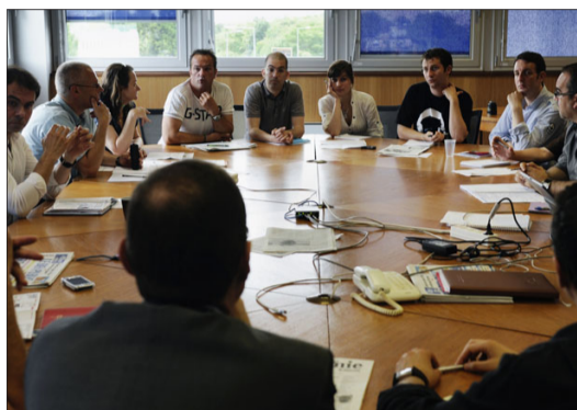
9 heures , réunion des journalistes de la rédaction pour préparer le journal du jour.