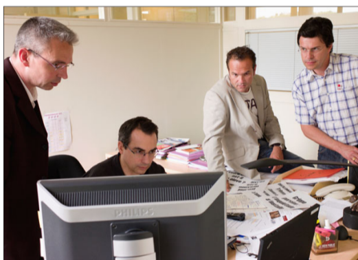
14 h 15 , un temps dédié aux affichettes destinées à la promotion du journal sur les points de vente.