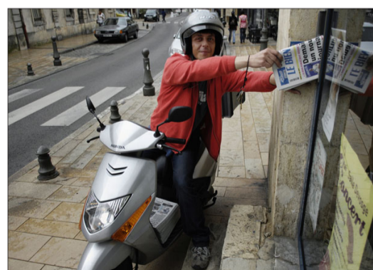
8 heures , les derniers journaux sont dans les boîtes aux lettres.