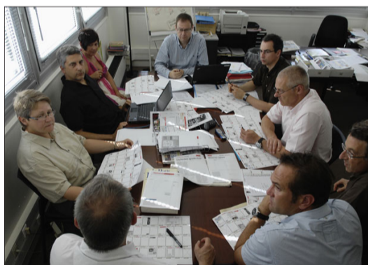
16 heures , réunion de programmation et d'échange pour la mise en place des contenus du surlendemain.