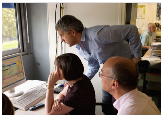
13 h 30 , mise en place de la pagination du cahier général et des quatre cahiers éditonnés.