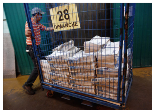
2 heures du matin , les journaux arrivent de la rotative par transporteur.