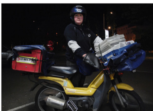
3 heures , début de tournée pour le service portage. Quel que soit le temps, le journal arrivera à bon port.