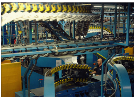
22 h 30 , l'impression du journal peut commencer à la rotative de Châtenoy-le-Royal.