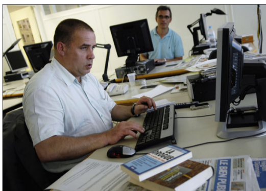
10 h 30 , les reporters commencent à travailler sur les sujets du jour.