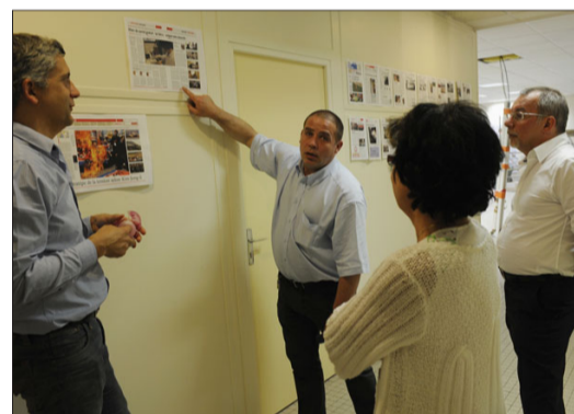
15 heures , les premières pages réalisées sont affichées au cœur de la rédaction.