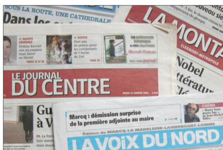
D'autres titres en tabloïd de la presse française

D'abord adopté par les titres de la presse gratuite (comme Métro), le format tabloïd (41 x 29 cm) s'est énormément répandu ces dernières années et derniers mois.